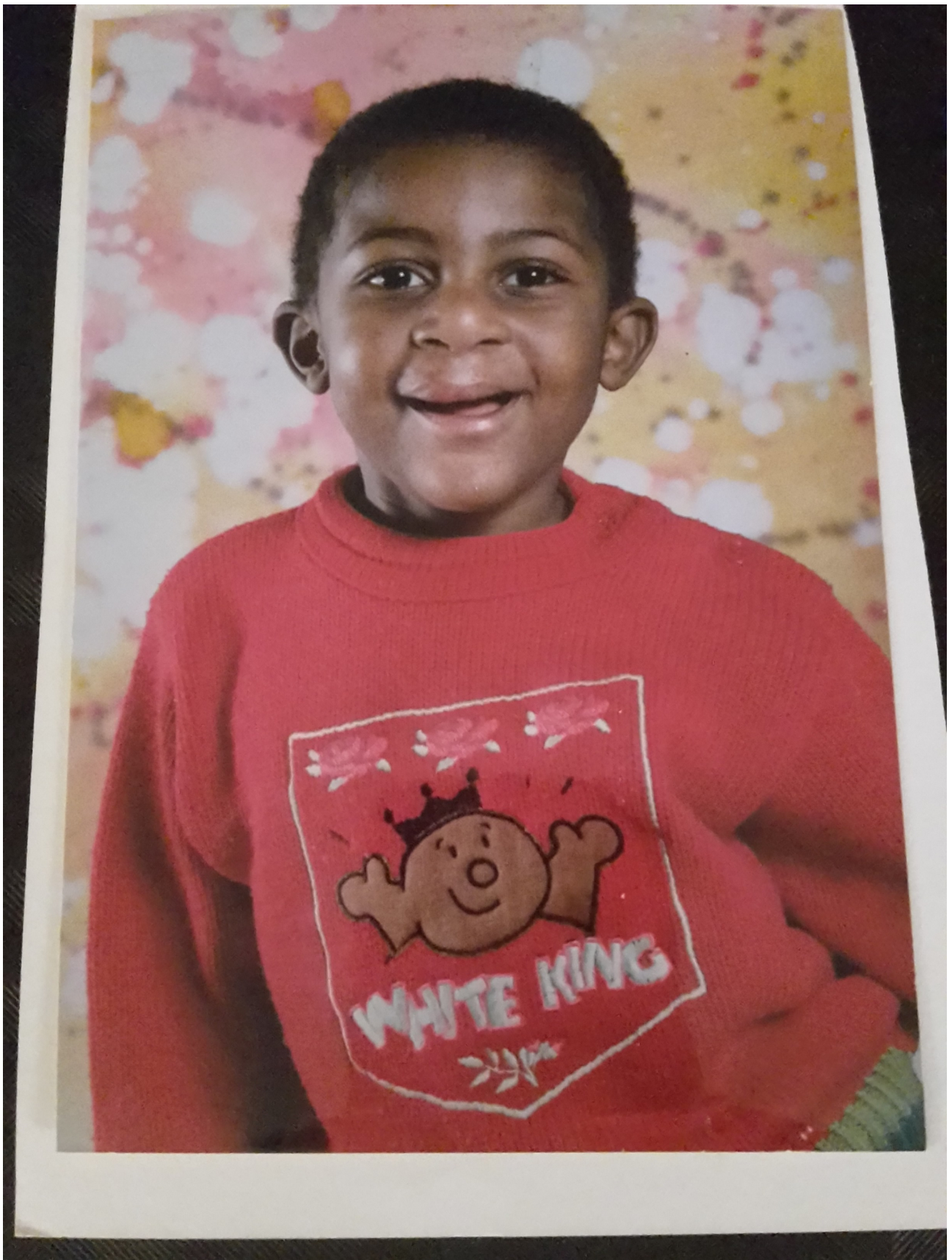
King Louis c'est le surnom de Louis Picamoles, un joueurs de rugby.